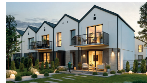
Widok budynku od strony ogrodu