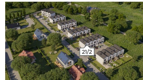
Widok osiedla z lotu ptaka