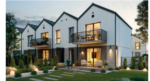
Widok budynku od strony ogrodu